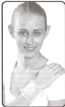
Wrist Wrap (Neoprene)